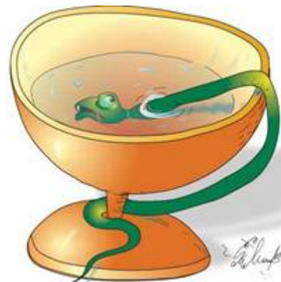
(с) Алексей Молчанов @leXXXa